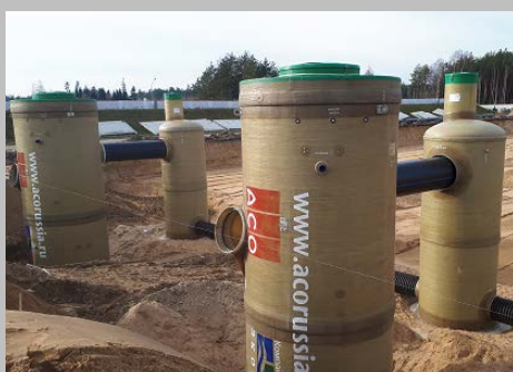
Индустриальный парк "Великий камень" "Оборудование для очистки поверхностного стока в составе ЛОС накопительного типа с самым большим в мире безбетонным аккумулирующим резервуаром АСО StormBrixx, Минск, Республика Беларусь